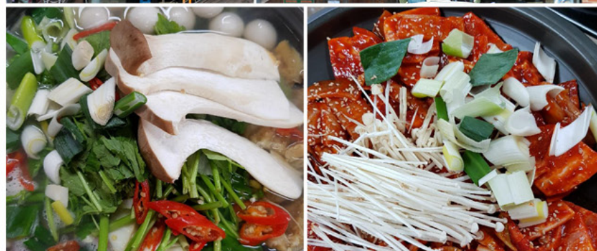
Visa優待特典の提供をお申し出下さい。20