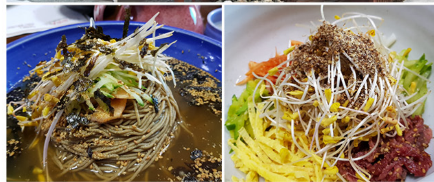
Visa優待特典の提供をお申し出下さい。14