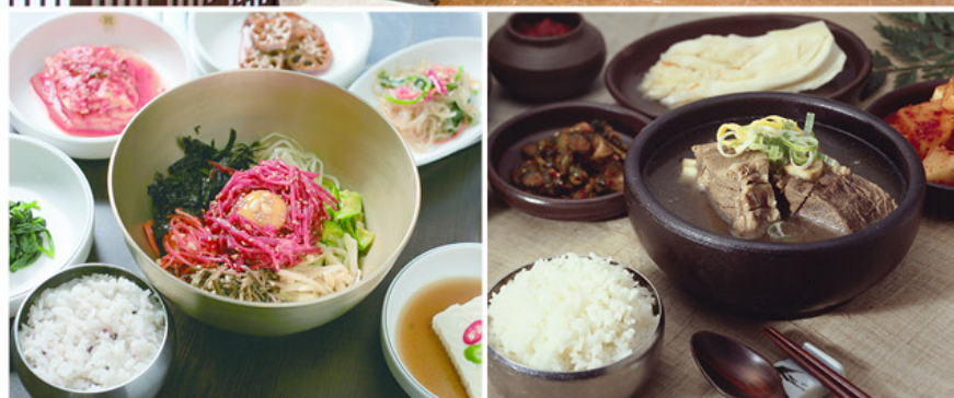
17 PyeongChang 2018 Visa Dining Offer