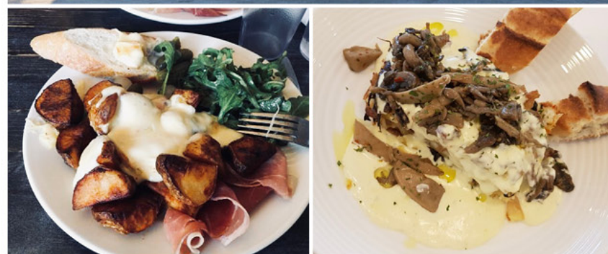
Visa優待特典の提供をお申し出下さい。18